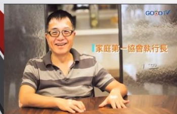
家庭第一協會執行長